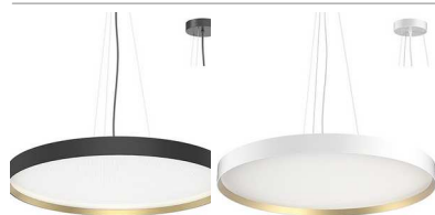
NOIR MAT - DORÉ